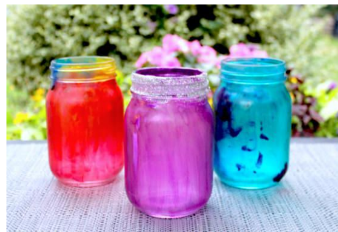
Lanterne Pot Mason (Art)