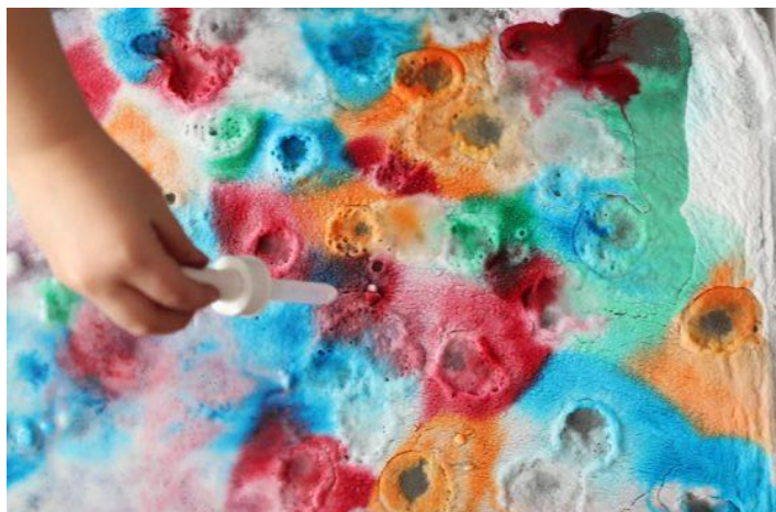
Réaction de bicarbonate de soude (Science)