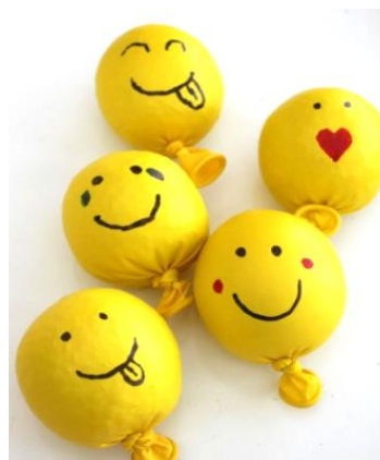
Créer votre propre balle antistress (Santé)