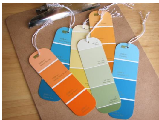
Créer votre propre marque-page (lecture)