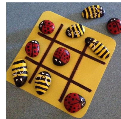
Morpion avec des insectes (Nature)